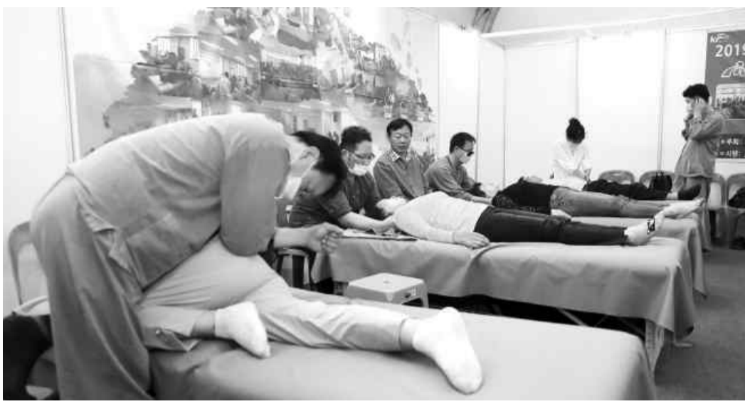
'2022 대한민국통합의학박람회'가 오는 30일부터 10월4일까지 5일간의 일정으로 안양면 장흥국제통합의학박람회장에서 열린다. 2019년 박람회 체험장 모습.

장흥군은 다양한 체험과 전시를 통해 통합의학을 한 자리에서 보고, 듣고, 경험할 수 있도록 행사를 마련했다.