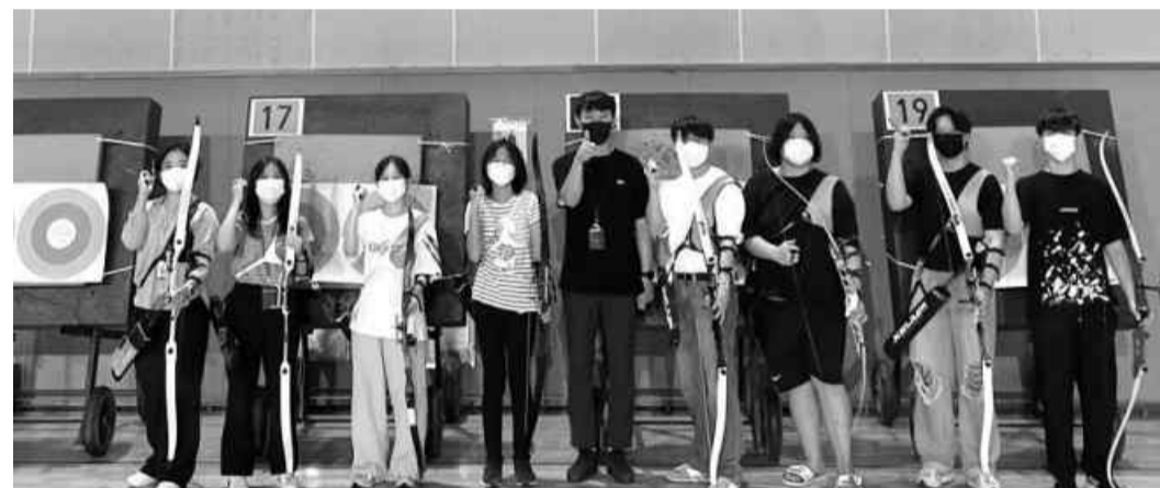
이색 스포츠 체험교실 중 양궁레슨 모습.