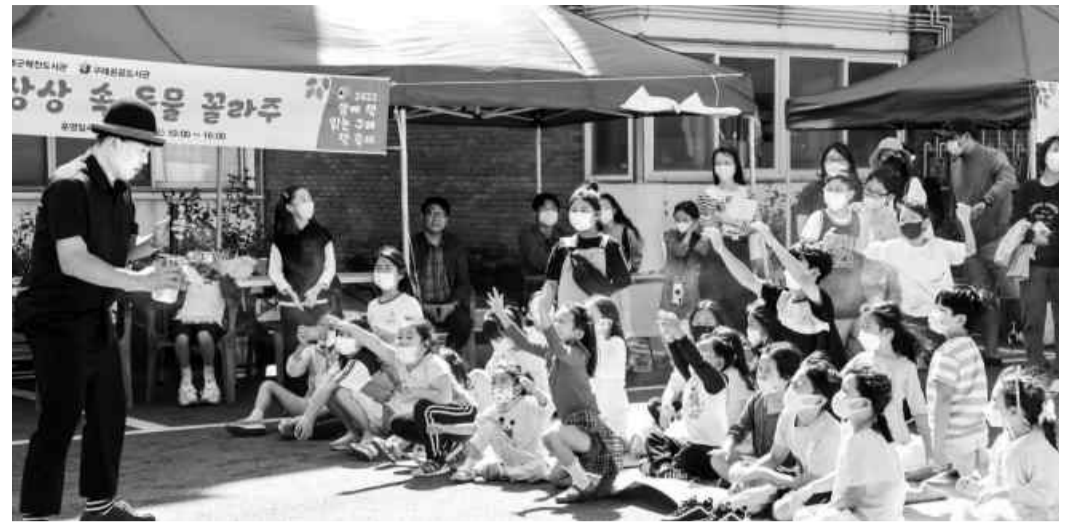
'함께 책 읽는 구례 책 축제' 모습.