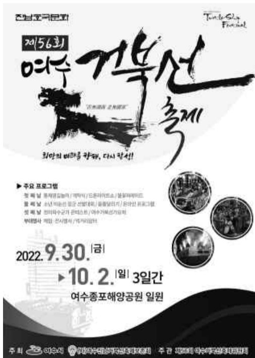
환상적인 연출로 가을밤하늘을 수놓게 된다. 둘째 날에는 소년 이순신 선발대회, 거문도보트 레 시연, 용출다리기 시연 등이 진행되고, 마지막

2019년 도입 이후 큰 호응을 얻고 있는 드론 라이트 쇼는 기존 100대에서 600대로 규모를 대폭 확대해 해전전법, 판옥선, 거북선, 이순신장군 등