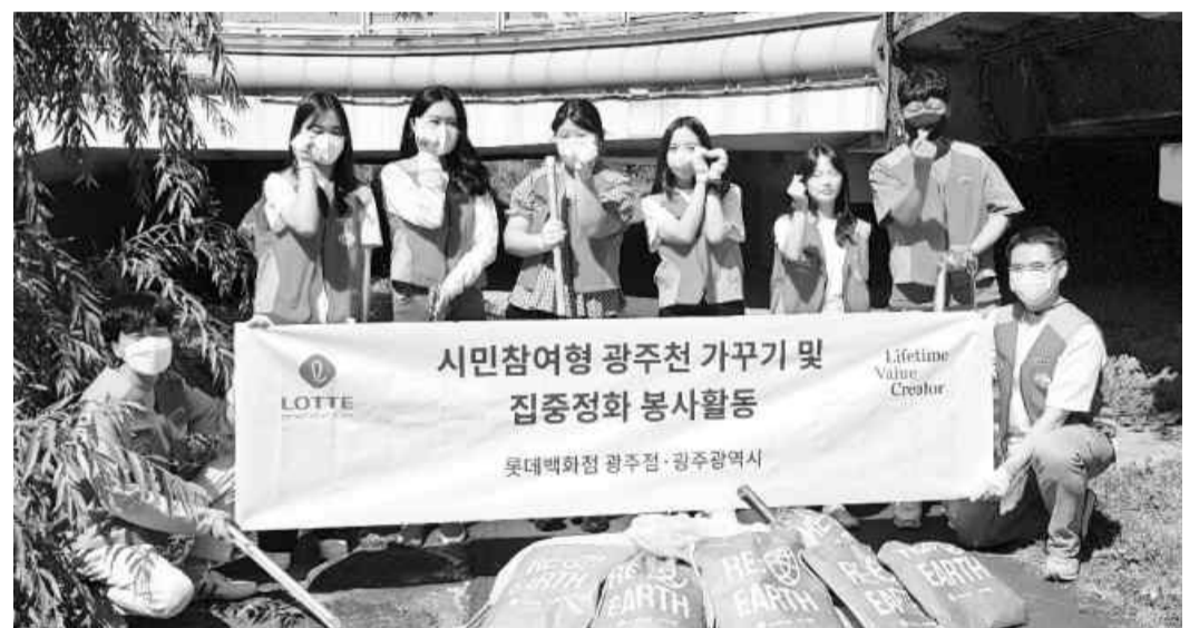
“쓰레기 줍고 건강 챙겨요” 롯데백화점 광주점 샤프테봉사단이 29일 오전 광주천 일대를 걸으며 쓰레기를 줍는 ‘플로깅’ 봉사를 했다. 이는 롯데백화점 친환경 캠페인 ‘리:어스’(Re:Earth)의 하나로 진행됐다.

하기 위해 마련했다. 이번 인식개선 목적의 세미나를 시작으로 다음 달 6일부터 11월까지 3회에 걸쳐 CEO 대상 맞춤형 ESG교육도 진행될 예정이다. 산단공은 기업의 ESG 확산을 위해 교육 뿐만 아니라 기업방문 무료컨설팅과 ESG형 산단 공동 혁신 연구개발(R&D) 지원사업을 통해 산업단지 중소기업의 ESG 기반 경쟁력 모델 발굴과 확산을 위한 사업들을 추진하고 있다. /박기용 기자 pbxer@kwangju.co.kr