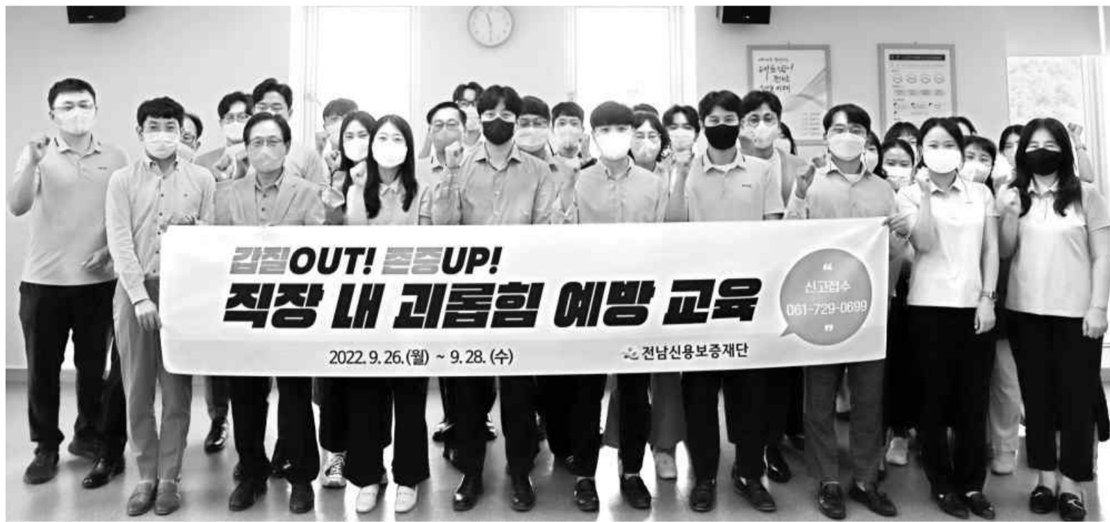
“갑질 OUT” 직장 내 괴롭힘 안돼 전남신용보증재단이 지난 28일까지 사흘에 걸쳐 임직원을 대상으로 진행한 ‘직장 내 괴롭힘 예방 교육’에서 참가자들이 상호 존중하는 성숙한 조직문화 조성을 다짐하고 있다.

42.0%에 달했다. 지역 소상공인들이 코로나19 지원사업을 신청해 지원받은 비율은 광주 68.8%·전남 65.6%이었다. 지원을 받지 못했다는 비중은 광주·전남 두 지역 각각 21.0%였고, 신청한 적 없었던 비율은 광주 10.2%·전남 13.4%로 집계됐다. 코로나19 지원사업에서 받은 지원금의 절반 이상은 원자재나 부품을 구입(광주 32.0%·전남 23.3%)하거나 각종 세금을 납부(광주 17.2%·전남 29.1%)하는 데 썼다. 인건비를 지급하는 데 쓰겠다는 응답률은 광주 21.9%·전남 17.5%에 달해 빚을 내서 운전자금을 충당하라는 대출 수요를 확인할 수 있었다. 소상공인에게 필요한 코로나19 정책으로는 광주 43.0%·전남 35.0%가 '소상공인 긴급경영 안정자금 대출'을 꼽았다. '별도 재난수당을 지원'(광주 23.7%·전남 12.1%)하거나 '부가세 등 직간접세 세제 혜택을 주거나 감면'(광주 9.1%·전남 26.8%)해달라는 요구도 있었다. /백희준 기자 bhj@kwangju.co.kr