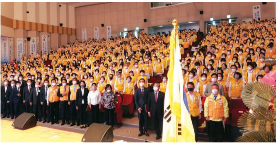
대한적십자사 광주전남지사는 최근 여수엑스포전시관에서 ‘제 13회 적십자봉사원대회’를 성료했다고 밝혔다.