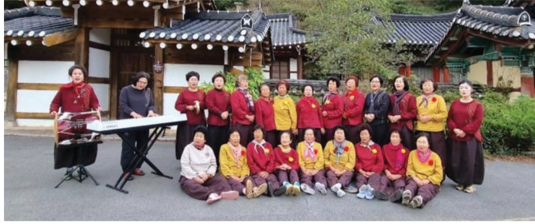
함평 상모마을 어르신 30여명으로 이뤄진 '도토리 합창단' 모습.

박 사무장이 만든 마을 향가인 ‘희망찬 상모’도 큰 호응을 얻었다. 3분 남짓의 향가는 상모마을의 역사와 자원을 곡에 담아 노래한 것으로 전남 행복마을 콘테스트에서 최우수상을 연속 수상했다. 전국 마을 뽐내기 대회에서도 1등 상을 거머쥐며 ‘실력파’ 마을 합창단임을 증명했다.