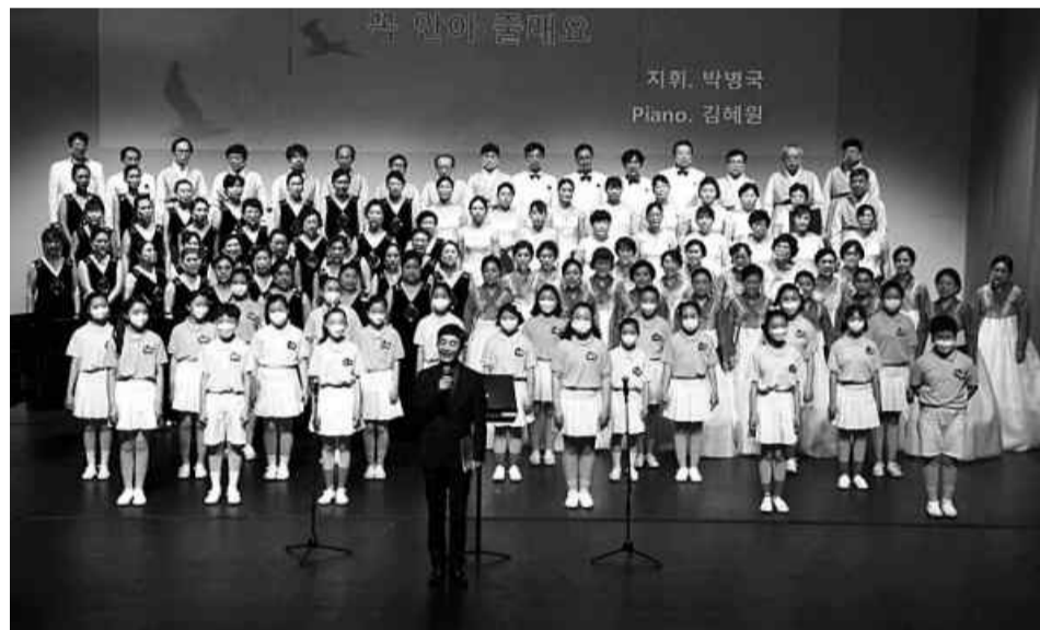
지난해 열린 제 32회 광주 음악제 공연 모습.