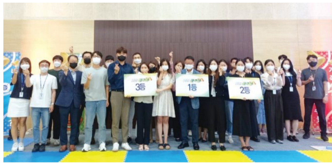
나주 빛가람혁신도시 이전기관들이 최근 사립학교교직원연금공단 나주 본부에서 개최한 ‘제8회 빛가람 청렴문화제’ 청렴골든벨 대회에서 한국문화예술위원회 등 수상단체가 기념촬영하고 있다.