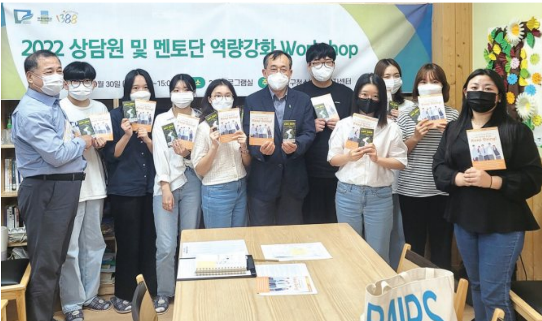
광주대학교(총장 김동진)가 위탁 운영하는 남구청소년상담복지센터는 최근 개소 10주년을 기념해 직원·멘토 역량 강화 워크숍과 아웃리치 프로그램을 진행했다.