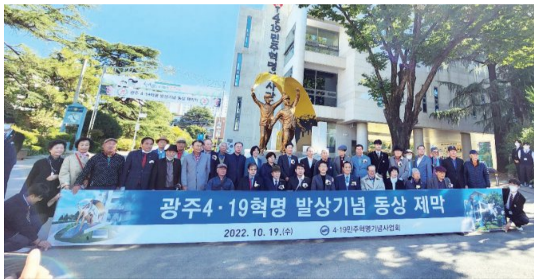
광주·19혁명 발상기념 동상 제막식이 19일 오전 4·19민주혁명 역사관에서 열렸다. 이번 동상 제막은 4·19혁명 당시 민주이념인 '자유, 민주, 정의'를 계승시키기 위해 마련됐으며, 62년 전 4·19혁명 당시 광주 학생들이 불의에 항거했던 모습을 재현했다.