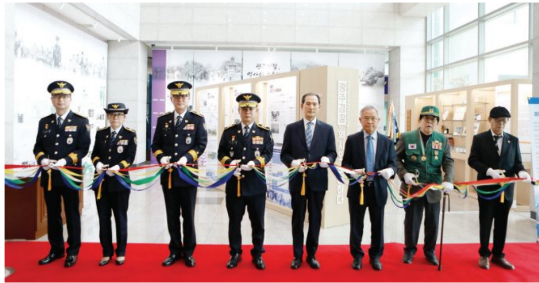
광주경찰청이 제77주년 경찰의 날인 지난 21일 광주경찰청사 1층에서 ‘광주경찰 역사관’ 개관식을 진행했다.