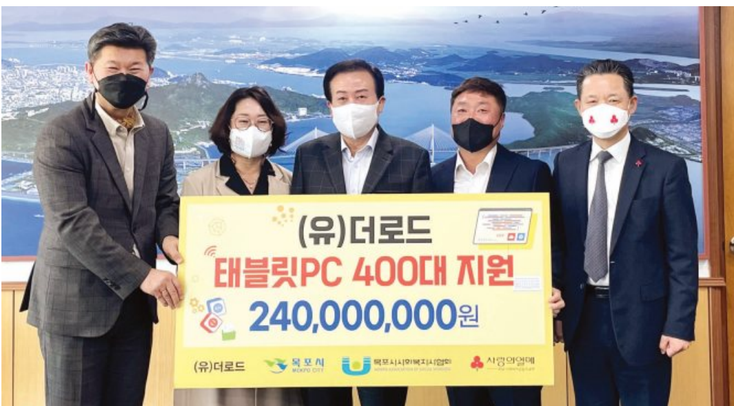
(유)더로드는 31일 목포 학교 밖 청소년, 드림스타트, 그룹홈, 지역아동센터 등에 2억 4000만 원 상당의 태블릿 PC 400대를 전남 사랑의 열매를 통해 기탁했다.