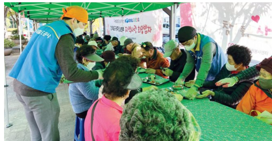
한국철도 광주전남본부는 최근 순천의료원 광장에서 소외계층 약 700여명을 대상으로 ‘지역사랑 희망밥차’를 진행했다.