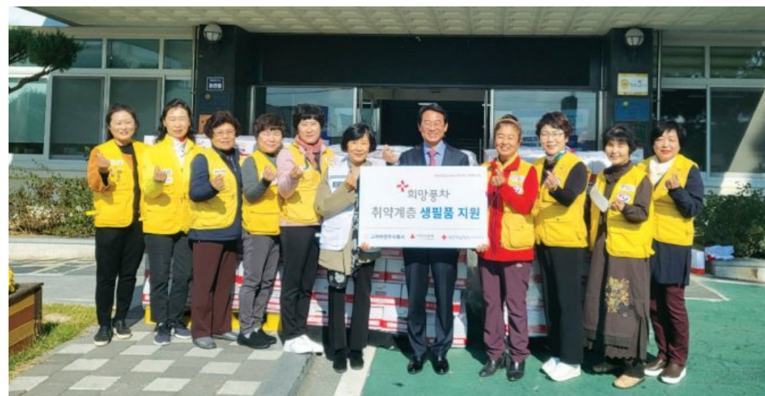
대한적십자사 광주전남지사는 최근 강진군 취약계층을 위한 630만 원 상당의 희망풍차 백미-잡곡세트를 210세대에 전달했다.