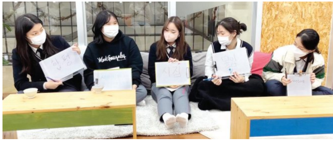
광주 설월여고 학생들은 지난달 독립출판 프로젝트 ‘책 쓰는 여름’을 통해 에세이 4편과 소설 4편이 담긴 ‘여름의 눈꽃’을 발간했다.

었고 같은 학교 아래 얼굴도 모르고 지냈던 8명이 책이라는 하나의 목표로 함께 모였기에 학교 ‘설월’의 ‘눈설’자를 따서 ‘여름의 눈꽃’이라 이름붙였다”고 뜻을 설명했다.