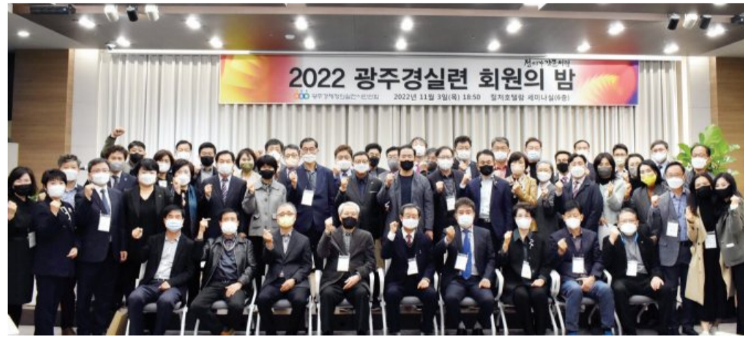
광주경제정의실천시민연합은 최근 컬처호텔 램 세미나실에서 내외빈과 회원들을 초청해 '2022 경실련 회원의 밤' 행사를 개최했다.