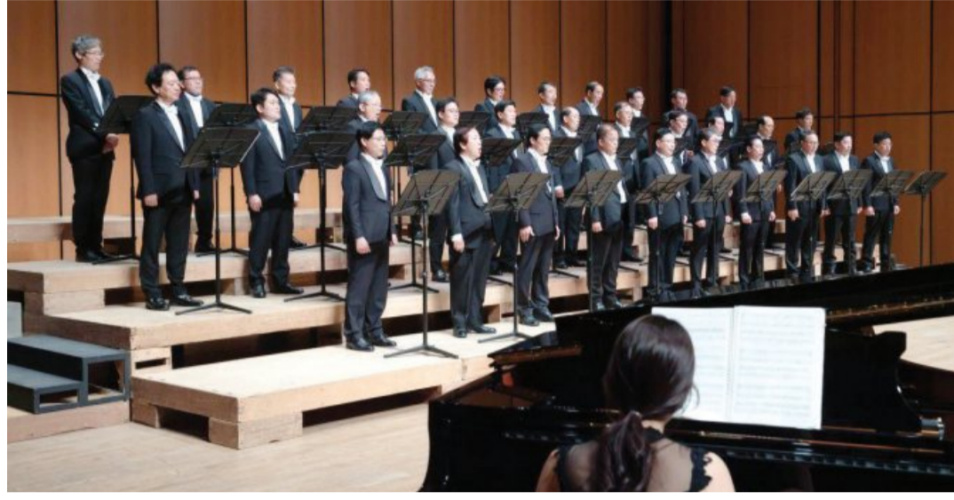
지난 1998년 창단된 아버지합창단의 정기 공연 모습.