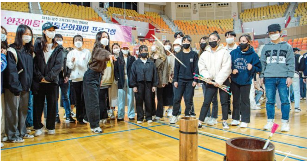
제1회 한공이름 전통문화 체험 프로그램이 10일 오전 광주여대 체육관에서 열린 가운데 중국, 일본, 베트남 등에서 유학 온 학생들이 투호놀이를 체험하고 있다.