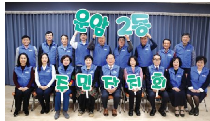
으며 폐신발 업사이클링, 기자회견 조성 등 철길 주변 낙후된 생활환경 개선과 학습마을추진단 운영, 마을미래계획 수립, 기후위기 대응활동 등 미래세대 위한 자치활동을 펼쳐왔다.

광주 북구가 ‘2022 좋은이웃 밝은동네’에서 2관왕의 영예를 안았다. 북구는 최근 ‘2022 좋은이웃 밝은동네’ 시상에서 운암2동 주민자치회(사진)가 대상을, 운암1동 해오름마을공동체가 공로상을 수상했다고 밝혔다. ‘좋은이웃밝은동네’는 광주방송문화재단이 주최·주관하고 광주광역시가 후원하는 행복하고 희망찬 지역 만들기 위해 앞장선 개인과 단체를 선정해 시상하는 프로젝트다. 대상을 수상한 운암2동 주민자치회는 철도로 인해 단절된 마을을 잇는 노후화된 보행공간인 광암지하 보도 환경개선사업을 주민 역량을 모아 추진했