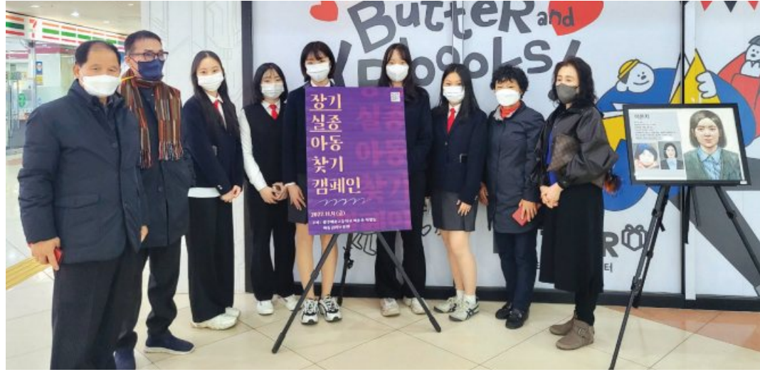
광주예고등학교 학생들이 지난 4일 장기 실종아동 찾기 특별전을 통해 직접 그린 그림 8점을 선보였다. <이하윤양 제공>

실종아동을 알려보자”는 이 양의 말에 많은 친구들이 동참 의사를 밝혔고 1학년 학생들까지 끌어들여 총 8명이 프로젝트에 함께하게 됐다. 프로젝트의 시작은 아동권리보장원을 통해 실종아동 사진을 받는 일이었다. 이 양은 메일을 통해 아동권리보장원에 프로젝트를 설명하고 아동들의 성인이 된 모습을 넘겨받아 그림으로 그렸다. 전시 장소 선정도 어려웠다. 학생 신분으로 동분서주 하며 장소를 섭외했지만 퇴짜를 맞기 일쑤였다. 그러던 중 학교 선생님의 도움을 받아 유스퀘어 영풍문고 앞에서 전시할 수 있게 됐다. 전시장소가 전국에서 온 사람들이 오고 가는 종합버스터미널인 만큼 그림을 보기 위한 인파로 가득했다. 과연 효과가 있을까 우려했던 생각이 안심으로 바뀌는 순간이었다. 비록 하루동안 진행된 전시였지만 실종아동에 대한 관심으로 인산인해를 이루었다.