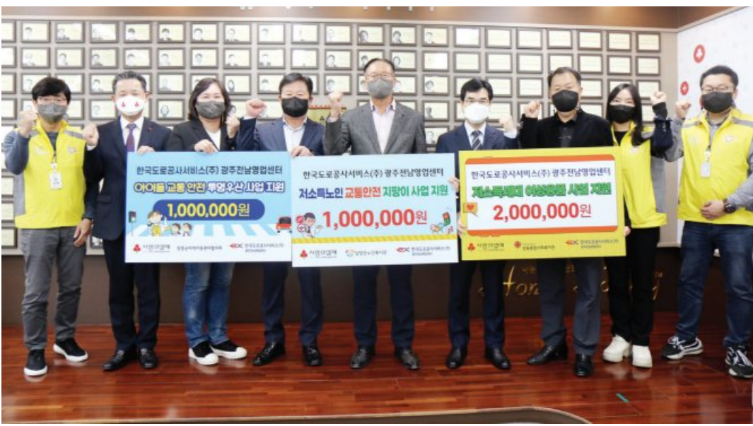
한국도로공사서비스 광주전남영업센터는 최근 목포시, 장흥군, 담양군 복지사업을 위해 전남사랑의열매에 성금 400만 원을 기탁했다.