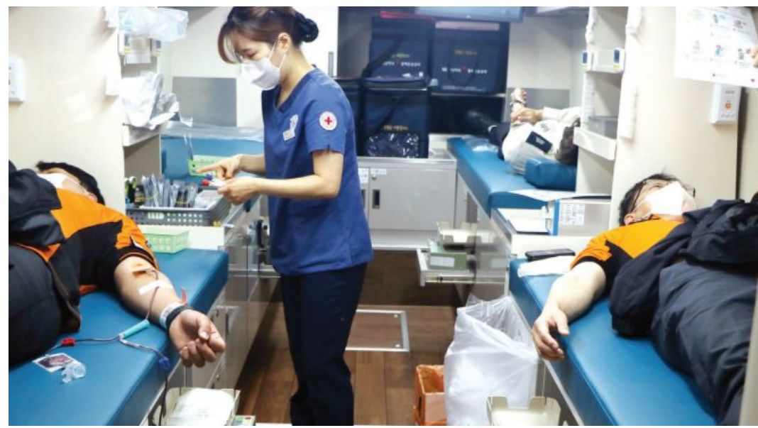
광주 동부소방서는 최근 동부소방서 차고 앞 적십자 이동 헌혈차량에서 소방공무원을 비롯한 의용소방대원의 참여로 생명나눔과 이웃사랑 실천을 위한 헌혈활동을 실시했다.