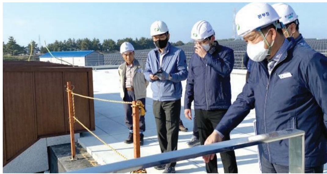
한국수력원자력 한빛원자력본부는 안전사고 예방을 위해 지난달 31일부터 지난 11일까지 ‘한빛본부 안전관리 특별강조기간’으로 정하고 안전캠페인을 실시했다.