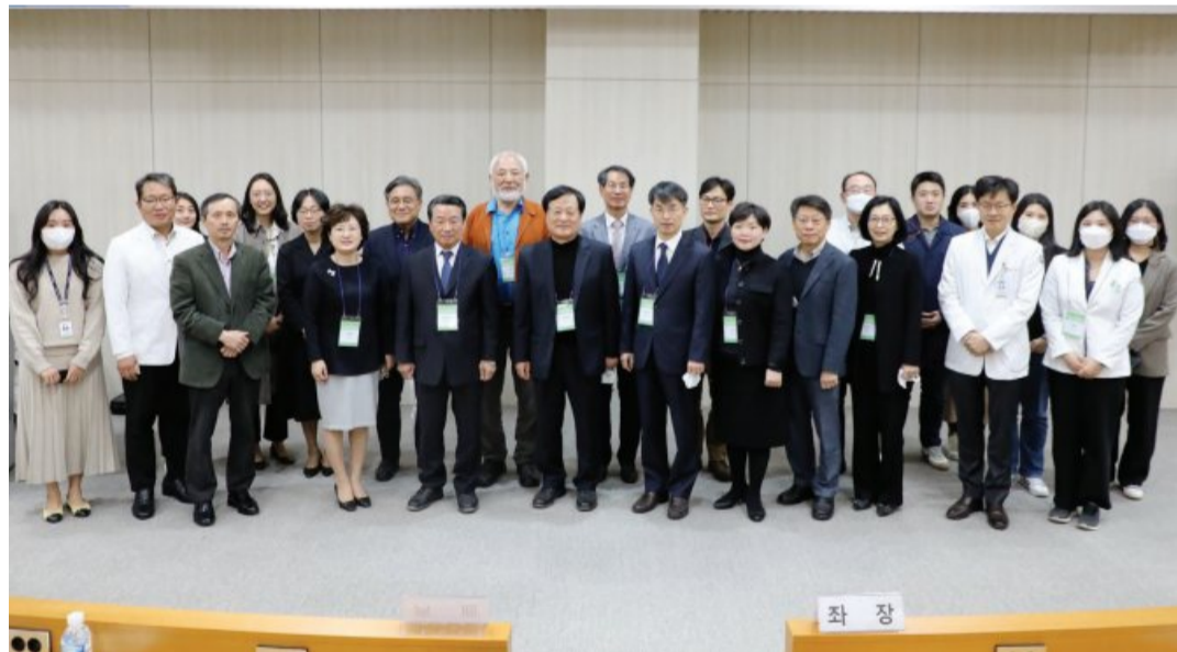
전남대병원 한국백세인연구단은 최근 전남대 학동캠퍼스 행정동 6층에서 현판식을 가진데 이어 의생명연구지원센터 1층 강당에서 제13차 건강백세포럼을 개최했다.