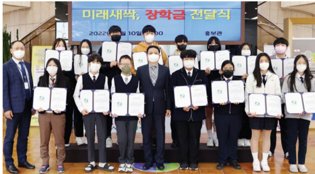
한빛원자력본부는 최근 지역 학생들에게 평등한 교육 기회를 제공하고자 한빛본부 주변 지역 중·고등학생을 대상으로 하는 ‘미래세상’ 장학금 전달식을 진행했다.