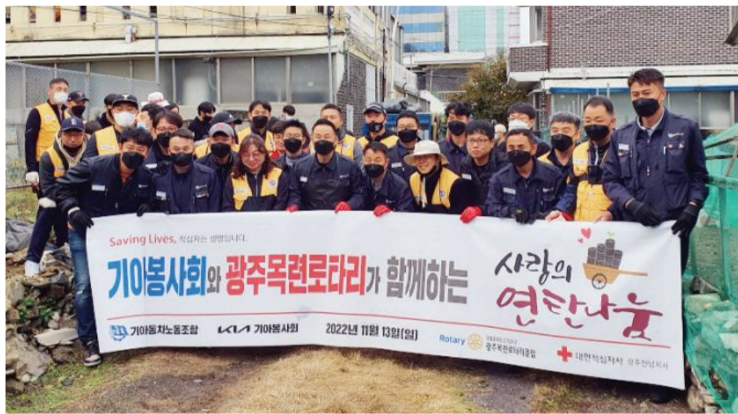
기아적십자봉사원과 광주목련로타리 회원 34명은 최근 광주시 남구 월산동 일대에서 '사랑의 연탄나눔' 봉사활동을 펼쳤다.