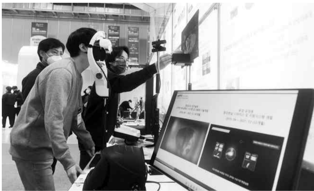
국내 유일 광산업 전문 전시회인 국제광융합산업전시회가 23일 광주 서구 김대중컨벤션센터에서 개막해 관람객들이 의료수술현장용 투시형 AR영상의로기 시스템을 보고 있다.

혁신적 광융합 기술과 제품을 한자리에서 볼 수 있는 '2022 국제광융합산업전시회'가 23일 김대중컨벤션센터에서 개막했다. 올해 20회째를 맞은 이번 행사는 국내 최대 광융합분야 전시회로, 코로나19 이후 침체된 산업 경쟁력을 끌어올리고 광융합 관련 신기술 교류의 장을 열기 위해 마련됐다. 24일까지 진행되는 이번 전시회에는 LG이노텍, 금호전기 등 국내 선도기업 6곳과 에이비추얼, 유포터위 등 116개 유망기업 및 16개 지원기관이 참여한다. 주요 전시품목은 초소형 Si 광스캐너, 통합 도판 광 전력 분배 장치인 PLC스플리더, 다파장 LED 광원, 광센서, LED 투광디스플레이, 무채혈 진단기, 충격 감시 가로등 등이다. 또 구직자를 대상으로 일자리채용홍보관을 운영하고 광융합산업분야 직무소개 및 취업정보 등을 제공하는 프로그램도 별도로 진행한다. 이 밖에도 ▲광의료헬스산업 협동조합 ▲광의료헬스산업포럼 포럼 ▲PLC 라이다 기술교류 세미나 ▲MEMS기반 산업 기술교류 세미나 등