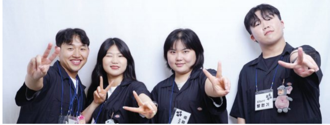
‘8844 벼룩시장’ 당시 완망진창 단체사진. 완망진창은 청년들이 자유롭게 물건을 사고 팔 수 있는 장을 만들기 위해 플라마켓 형식의 ‘8844 벼룩시장’을 계획했다.

“어르신들은 현대 문명을 따라가지 못하셨을 뿐, 오랜 세월 살아오며 체득하신 능력과 지혜를 겸비하고 있습니다. 집을 구하는 일 등 청년세대가 어르신들께 받을 수 있는 도움이 적지 않죠. ‘손주학교’는 청년층은 어르신들의 애로를 해결해 드리고 어르신들은 청년들의 문제 해결에 도움을 주시는 선순환을 모도하는데 목표가 있습니다.”