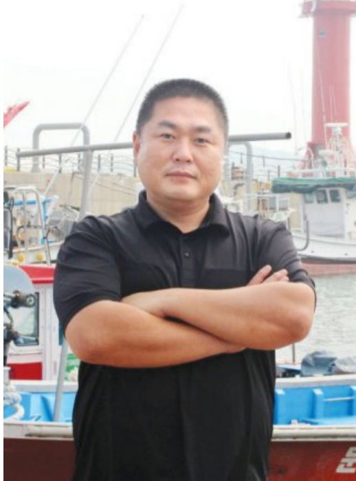
갖추기 위한 기본 교육을 진행하고 2박 3일간 남해에서 해역별 교육을 받았다. 또 실제 관광객들을 대상으로 해설 교육 실습 및 바다해설사 선배들에게

신 곳이 전남 순천이기에 영광은 그다지 멀게 느껴지는 곳이 아니었다. 그는 공동체 생활을 오래했던 영광으로 영광 생활에 적응하는 일은 그다지 어렵지 않았다고 말했다. 해양수산부는 보다 유익하고 흥미로운 바다 관광을 위해 올해 바다해설사 25명을 모집했다. 지난 2010년 도입된 바다해설사는 수산자원과 어구·어법, 어촌·어항의 역사와 문화 등에 대한 해설을 제공하는 역할을 한다. 현재 전국의 252명의 바다해설사가 어촌체험휴양마을을 중심으로 활동하고 있다. 이번 바다해설사 경쟁률은 5:1에 달했다. 이들은 지난 4월부터 10월까지 7개월간 100시간에 달하는 교육을 받고 필기·실기 시험을 거쳐 뽑히게 됐다. 먼저 온라인으로 바다에 대한 이해, 기본 소양을