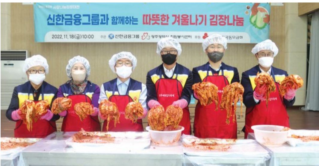
광주광역시 자원봉사센터는 최근 김치타운 다목적 체험관에서 ‘신한금융그룹과 함께하는 따뜻한 겨울나기 김장김치담기와 나눔’ 행사를 진행했다. 이날 임직원 및 자원봉사자는 직접 담근 김장김치 3180kg을 소외이웃들에게 전달했다.