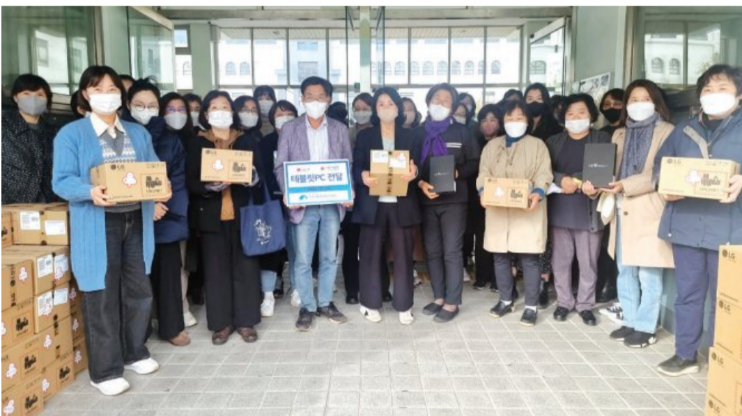
지역아동센터광주지원단은 LG유플러스 후원으로 광주사회복지공동모금회를 통해 3억2000만 원 상당의 태블릿 PC 1000대를 각 지역아동센터에 전달했다.