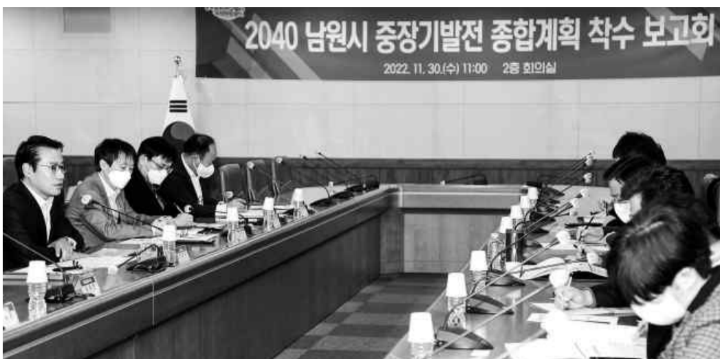
최경식(왼쪽 첫번째) 시장이 지난 30일 열린 '2040 남원시 중장기발전 종합계획 착수보고회'에서 남원시 미래 발전에 필요한 특산품 종합계획 수립할 것을 당부했다.

향 ▲지역 개발여건 및 잠재력 분석 ▲권역별·부문별·단계별 추진전략 및 실행방안 구상 ▲신성장산업 및 10대 전략사업 발굴 ▲재정구조 진단 및 재정투자계획 등에 대한 분석 등을 용역계획에 담아낼 예정이다.