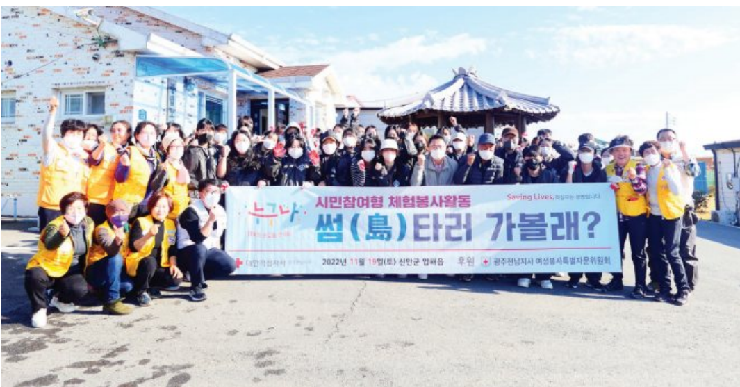
대한적십자사 광주전남지사는 최근 신안군 압해읍에서 시민참여형 체험봉사활동 ‘섬(섬)타러 가볼래?’ 섬마을 페인트 봉사활동을 실시했다. 이날 봉사원 및 RCY 회원 40여명은 섬마을 생활환경 개선활동, 페인트 칠 등 봉사활동을 진행했다.