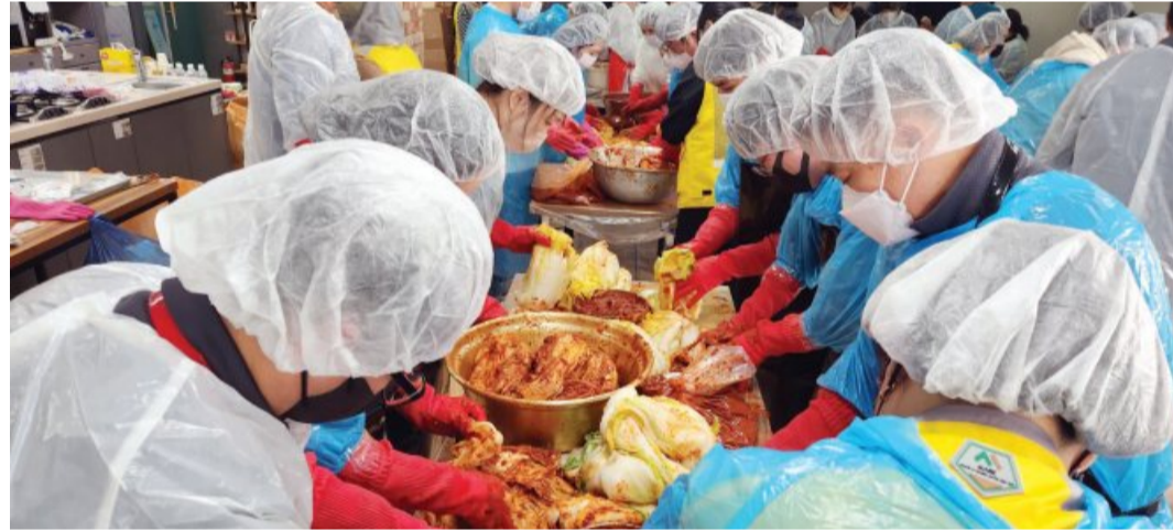
국립광주과학관은 지난 2일 '광주첨단산업단지 사회적가치 실현 커뮤니티' 회원 기관들과 함께 김장김치 600kg를 직접 담가 취약계층 120세대에 전달했다.