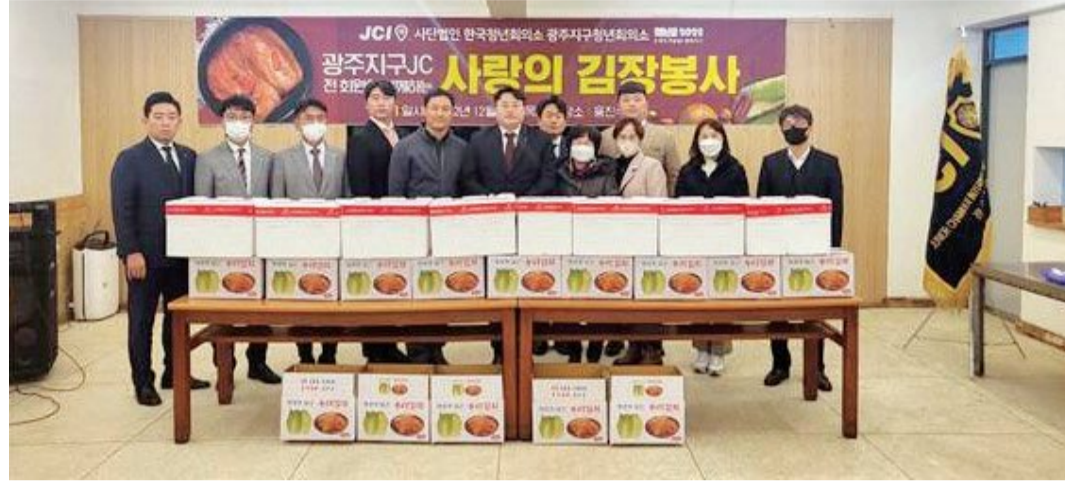
광주지구 JC 회장단 및 임원들은 최근 광산구 임곡동에 위치한 용진육아원에서 광산구 지역사회보장협의체 교육분과 위원들과 '사랑의 김장 나눔 전달식'을 진행했다.