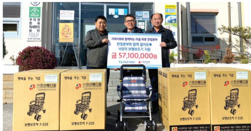
한빛원자력본부는 최근 지역 어르신들의 이동 편의를 위해 영광 흥농읍사무소에 보행보조기 500대를 지원했다.