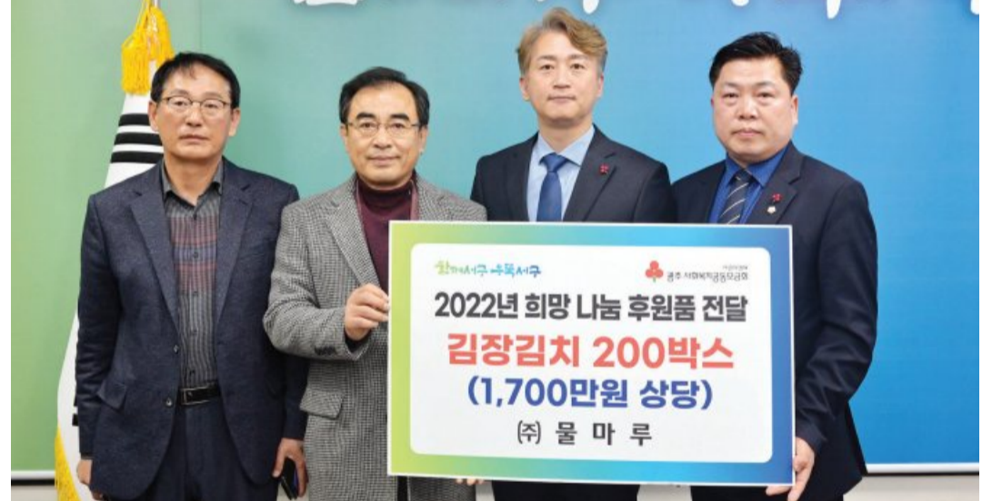
식품 제조업체 (주)물마루는 노인 및 장애인 복지시설 등에 1700만 원 상당의 김장김치 총 200박스를 후원하고 최근 서구청청사에서 사랑의 김장김치 나눔 전달식을 가졌다.