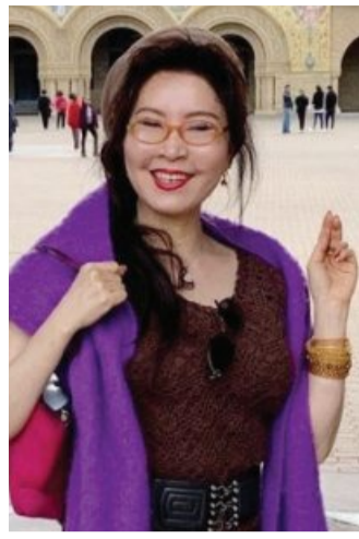
다양한 활동을 펼치고 있다.

김 교사는 대학에서 영어교육을 전공했다. 졸업 후 영시 암송을 하면서 시낭송 매력에 빠져들었다. 그러던 중 40대에 심각한 우울증을 겪었고 “시를 통해 인생에 변화가 필요하겠다고 생각해” 시낭송 대회에 도전했다. “몇 년 간 우울증으로 힘든 시기도 있었지만 시낭송으로 내면 치유의 효과를 경험하면서 회복의 과정을 겪었습니다. 노래를 부르듯, 음률을 실어 전달하면서 마음이 정리되고 정화되는 것을 느꼈거든요.” 그는 시낭송을 통해 삶의 고통을 승화시켜 바깥 세상으로 나올 수 있었다고 덧붙였다. 광주대 문예