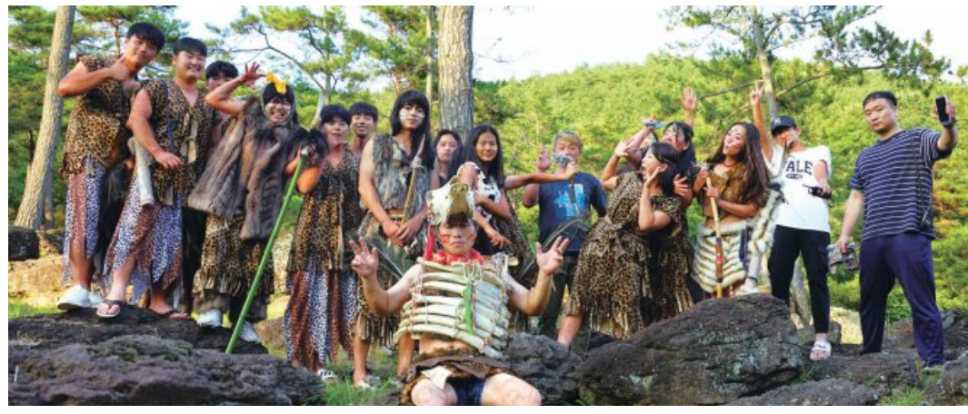
영화 ‘리브 인 고인돌’ 제작에 참여한 감독과 출연진들의 모습.