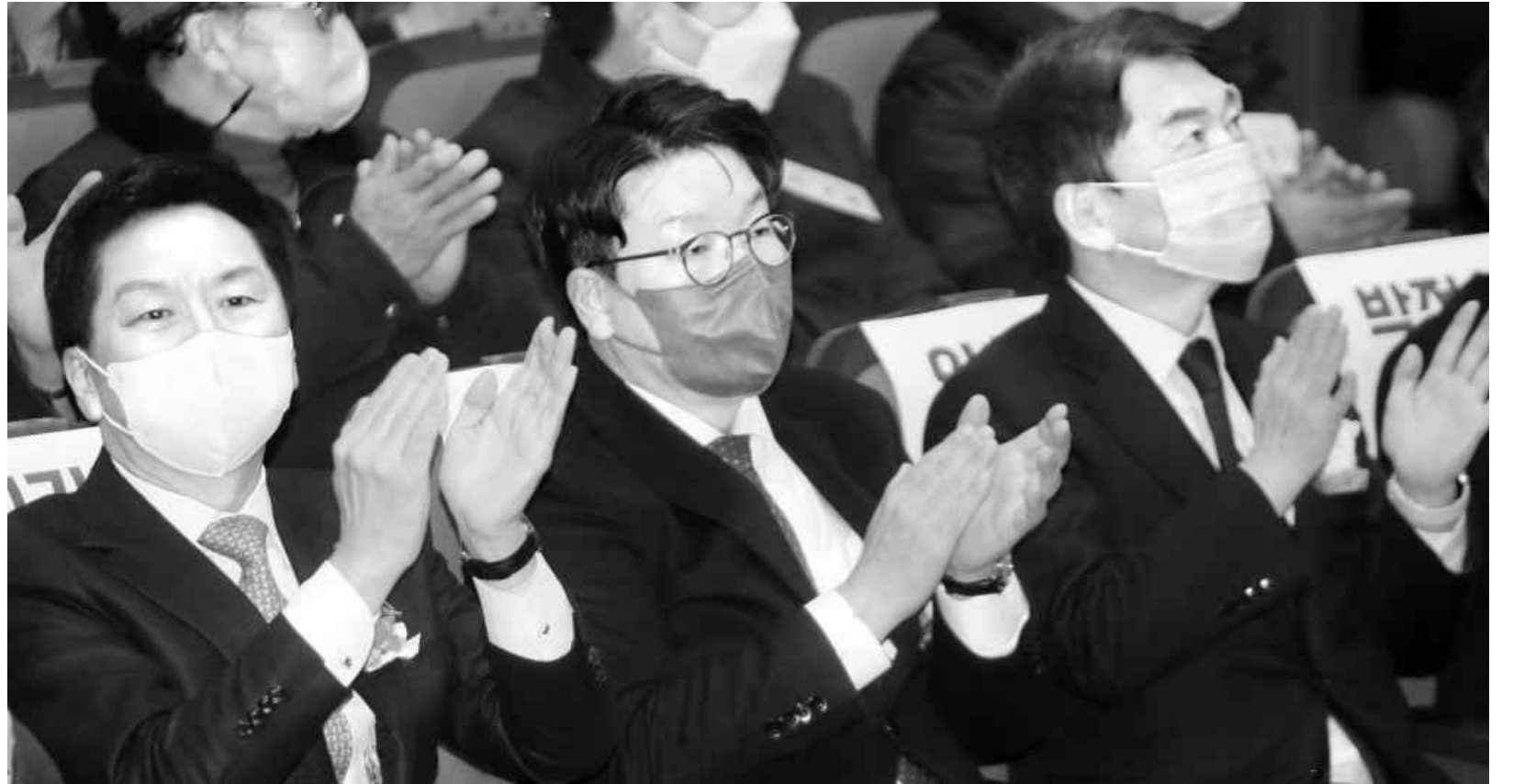
28일 오후 강원 횡성문화예술회관에서 열린 국민의힘 흥천·횡성·영월·평창 당원협의회 당원 연수에 김기현(왼쪽부터), 권성동, 안철수 의원이 참석해 박수를 치고 있다.

내달 둘째 주 공식 캠프 발대식을 가질 예정이다. 캠프를 총괄할 경선본부장에 박창식 전 의원이 합류했으며, 메시지·공보팀에 정의화 전 국회의장과 일했던 이수원 전 국회의원 비서실장과 김예령 전 국민의힘 대선 선대위 대변인 등이 함께한다고 김 의원은 전했다. 장 의원은 지난 26일 김 의원을 두고 "내년 전대에서 선출할 당대표의 가장 대표적 자질은 바로 연대해 통합을 이끌어 낼 수 있는 리더십인데 누가 80만 당원을 연대와 통합으로 이끌어 갈 것인가"라며 힘을 실어 바 있다. 이날도 김장연대를 둘러싼 견제와 주자들 간 신경전은 계속됐다. 법친윤계 주자인 윤 의원은 오전 SNS에서 당정 지지율을 동반 견인하겠다는 김 의원의 출마 공약을 두고 "좋은 포부"라며 "그렇다면 김 의원은 울산을 떠나 서울 출마를 선언하라"고 직격했다. 이어 "적어도 당대표 후보라면 언제라도 총선에서 수도권에 출마할 배짱이 있어야 한다"며 "윤심을 팔고 다니는 자칭 유훈관들은 모두 수도권 출마를 선언하라"고도 했다. 한편 권·김·윤·안 의원 4명은 이날 오전 박정화 의원의 지역구인 강원 원주갑 당원교육 행사장으로 일제히 향했다. 오후에는 유상범 의원 지역구인 흥천·횡성·영월·평창(유상범) 당원교육에도 대거