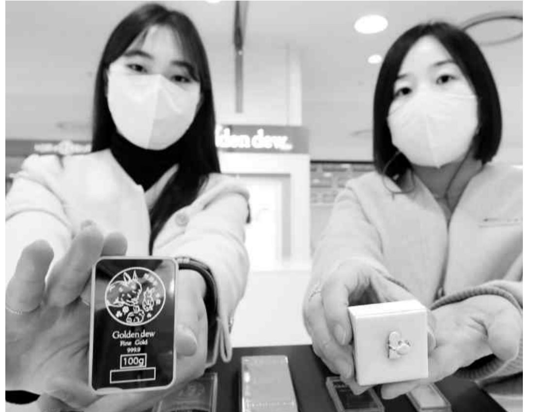
28일 롯데백화점 광주점 직원들이 2층 골든듀 매장에서 2023년 계묘년을 앞두고 새해를 상징하는 동물 토끼를 연상케하는 골드바와 돌반지를 선보이고 있다.