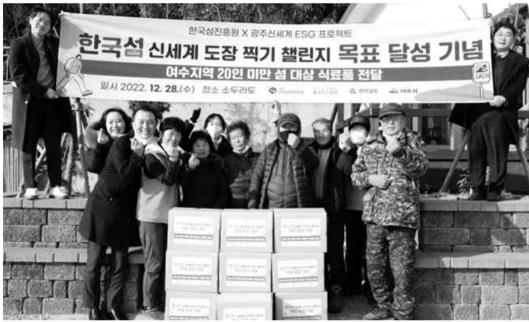
광주신세계 직원들이 28일 여수 소두라도를 찾아 '한국 섬 신세계 도장 찍기 챌린지' 목표 달성을 기념한 기념으로 주민에게 친환경 제품을 선물하고 있다.