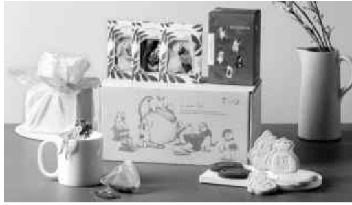
홀리데이 인 광주호텔 '2023, 묘(卯)해' 상품.

토끼 모양의 과자를 객실에서 즐기는 '2023, 묘(卯)해' 숙박 상품도 선보인다. 상품은 1박 객실 상품과 2인 조식권에 토끼 모양으로 포장한 루이보스 차, 새해 과자 꾸러미 등으로 구성했다. 구매 고객은 사우나와 피트니스 센터, 실내 수영장을 이용할 수 있다. 이 상품은 오는 31일부터 다음 달 24일까지 판매한다. 또 연말인 31일 입실하는 고객을 대상으로 '해피 래빗 뉴 이어' 행사를 진행한다. 해당 고객은 귀여운 토끼와 토끼 발바닥, 복주머니 모양을 새긴 과자를 받을 수 있다. 토끼 발바닥은 유럽이나 중국, 아프리카 등에서 행운을 상징한다. 매달 첫째 날 일어나면서 '토끼'를 세 번 외치면 행운이 온다는 영국과 북미권역 풍습에서 착안해 이번 행사를 마련했다. 편의점 CU는 계묘년 새해를 맞아 미피, 에스더버니, 토끼소주와 함께 다양한 토끼 캐릭터 상품을 선보인다. 도시락, 김밥, 햄버거 등 간편 식품부터 디저트, 생활용품, 주류까지 총 33종이다.