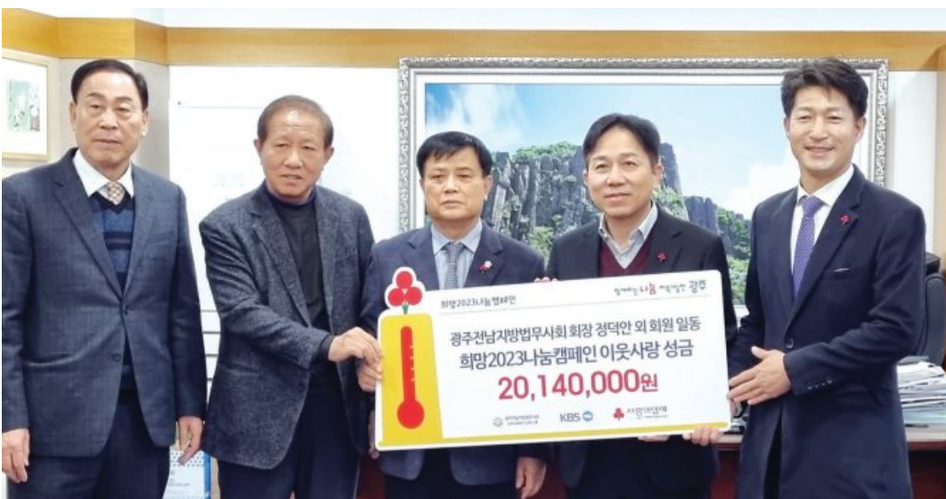
광주전남지방법무사회 회원들은 지난 28일 광주사회복지공동모금회의 '희망 2023 나눔캠페인'에 성금 2014만 원을 기부했다.