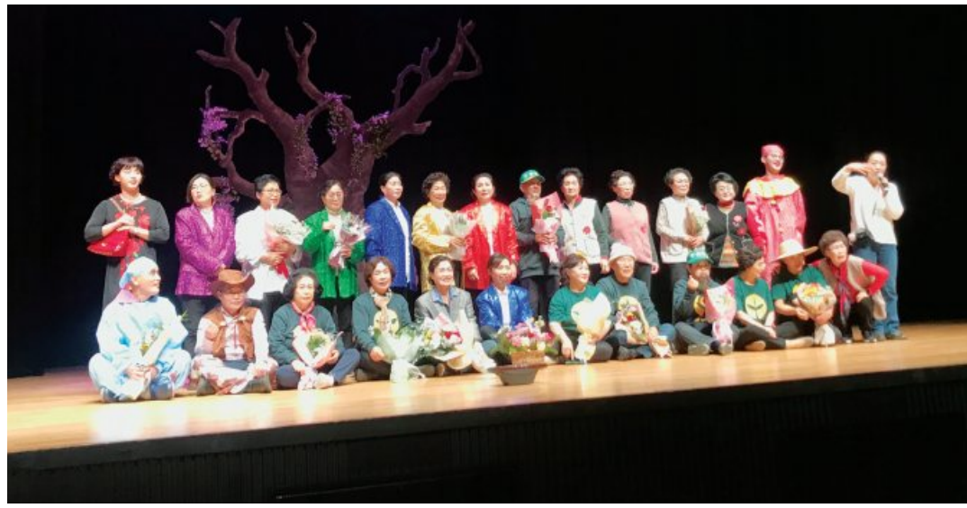
‘탄중일기&탄포세대의 꿈’ 연극에 배우로 참여한 해남군 어르신들.

관심을 갖고 실천을 생활화했다. 어르신들은 모임 때마다 물과 전기를 아끼는 것이 지구도 지키는 방법이라는 사실을 공유했다. 이러한 주민들의 탄소중립 실천에 대한 소문은 해남군 전역까지 퍼졌고, 해남군의 제안으로 연극까지 함께하게 됐다. 이번에 선보인 연극은 ‘탄중일기’와 ‘탄포세대의 꿈’. 먼저 여름과 겨울로 극명히 갈린 계절을 배경으로 하는 ‘탄중일기’는 난방파와 냉방파로 분리된 현실을 모티브로 한다. 이들은 결국 온실기와 온난이에게 고통받는다. 마을 주민들은 상대를 지복하며 고통의 원인이라고 비난한다. 그러던 중 이순신 장군의 환생인 환경운동가 ‘장군’이 마을에 나타난다. 마을 사람들은 ‘장군’과 힘을 합쳐 온실기와 온난이를 몰아낸다. ‘탄포세대의 꿈’은 공기 좋은 탄중 마을로 사람들이 모두 이사를 가고 마을에 남은 한 주인공 이야기다. 주인공은 황폐화된 마을 문제를 해결하기 위해 탄소배출 감소 방법을 알리는데 주력한다. 아울러 탄소포인트제와 에코드라이브 등 생활실천 사항도