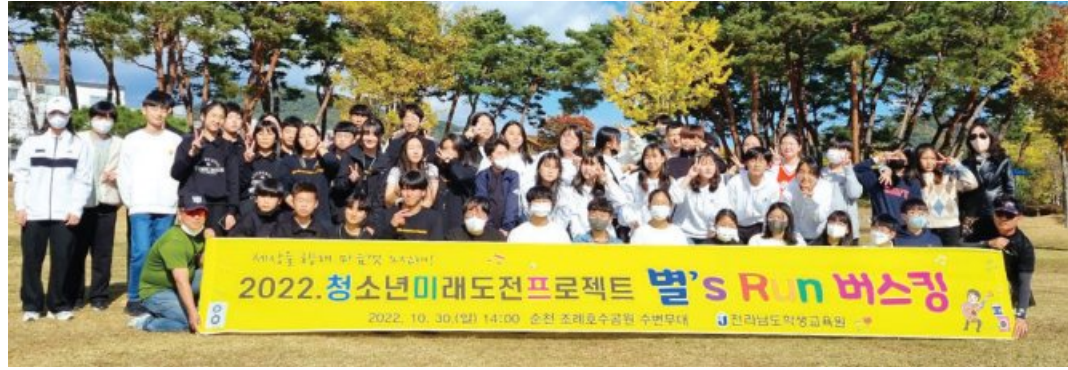
왕지앙상블은 지난해 10월 30일 순천 조례호수공원 수변무대에서 버스킹 공연을 열고 시민들에게 미니하프 연주를 선보였다.

은 없었지만 감 잡기 바뻐던 연주와 달리 연말에 가까워졌을 때는 다함께 공연도 다닐 만큼 실력이 늘었다.