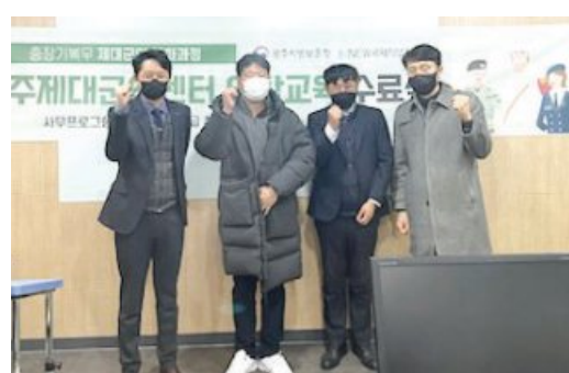
교육자원을 희망하는 제대군인은 홈페이지(www.vnet.go.kr) 또는 제대군인지원센터(1666-9279)로 문의하면 된다.

광주지방보훈청 제대군인지원센터는 5년 이상 국도방위의 임무를 성실히 수행하고 전역한 중장기복무 제대군인의 취업역량 강화를 위해 직업능력개발 교육, 사이버연수원교육 등 다양한 교육을 꾸리로 실시하고 있다.