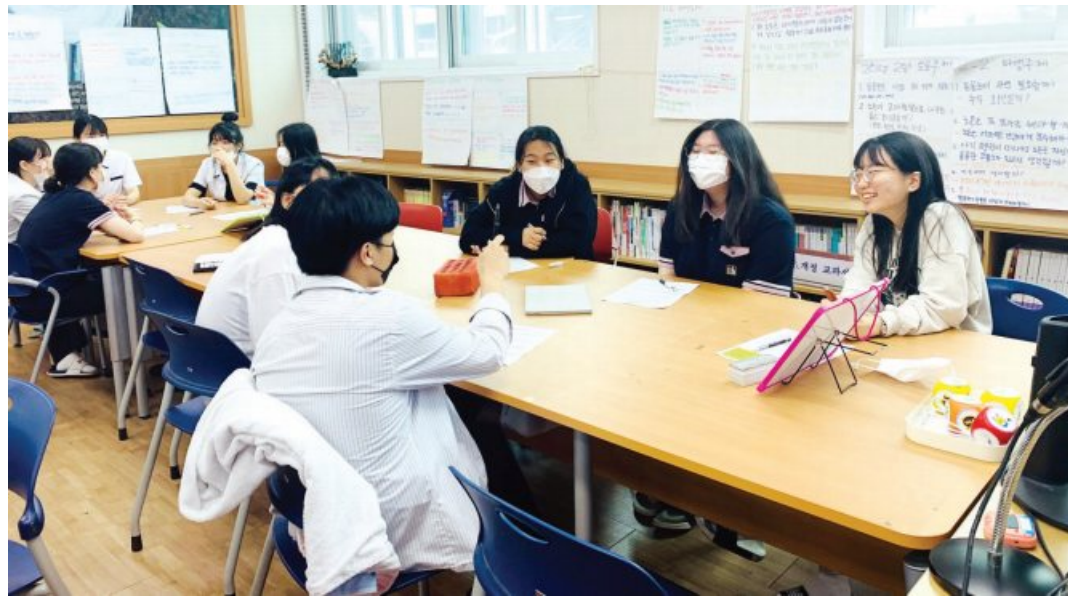
장성 문향고 학생들의 글쓰기 수업 장면.

이어 “처음에는 어려워하던 학생들도 ‘단점이라고 생각했던게 장점일 수도 있어’ 혹은 ‘너는 내가 생각하는 것보다 더 괜찮은 사람이야’라는 응원 말에 부담을 털고 적어갔다”며 “학생들의 글에는 학교 생활을 하며 힘들었던 순간을 비롯해 진로 고