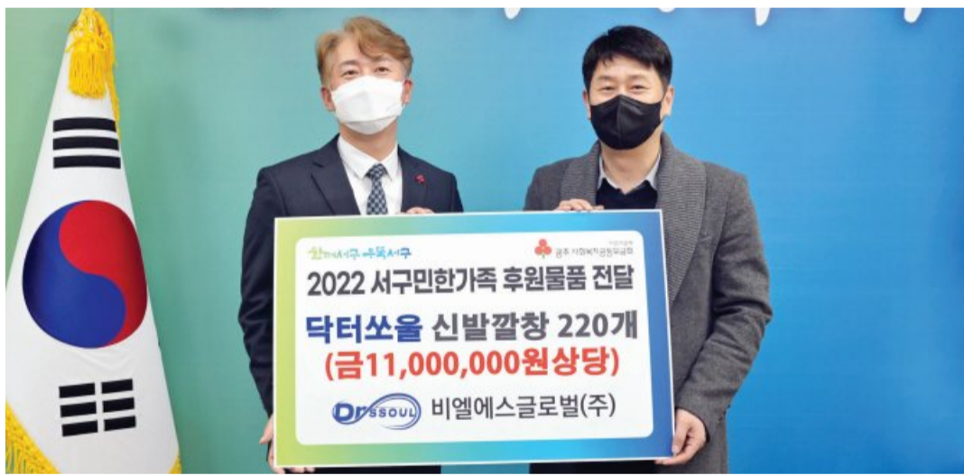
비엘에스글로벌(주)은 최근 오랜시간 걸으며 작업하는 환경미화원의 발 건강을 위해 1100만 원 상당의 닥터쏘울(기능성 깔창) 220족을 광주시 서구에 전달했다.