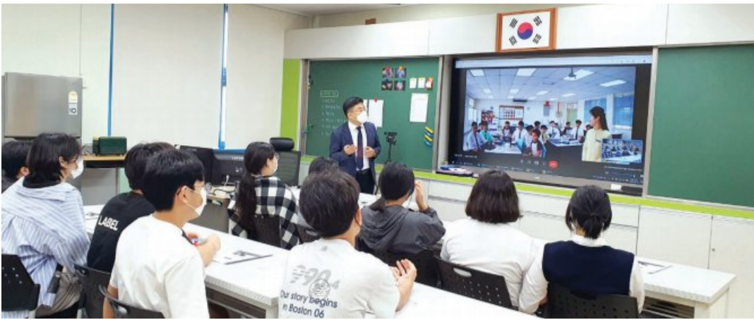
말레이시아의 중등학교 한국어반 학생들과 온라인 실시간 국제교류 수업을 진행하고 있는 모습.

원상 한번 받아본 적 없었는데 교육부 장관상을 받게 돼 뜻깊다”고 수상 소감을 밝혔다. 교사 생활 5년 만에 큰 상을 받을 수 있었던 것은 한 교사의 “학생들에게 다양한 경험을 하게 해주자”는 확고한 교육 가치관과 무관치 않다. 한교사는 지난해 7월부터 진로수업 시간을 활용해 말레이시아 세콜라 술탄 알랏 샤 중등학교 한국어반 학생들과 온라인으로 실시간 국제교류 수업을 진행했다. 학생들은 한국어와 영어로 자신을 소개하는 발표 시간을 가졌다. 이렇게 온라인으로 8차례 만난 학생들은 서로 SNS 맞팔을 하며 소통을 이어갔다. 또한 신안의 소금을 보내고 말레이시아의 열대과일을 받는 등 서로 선물을 교환하기도 했다. 지난해 10월에는 통일부 주관 “2022년 학교 통일 체험교육”에 선정돼 남북분단 현장을 직접 방문하는 시간을 가졌다. 7시간 기차 버스를 타고 경기도 파주로 이동한 뒤 민간인 통례선을 지나 도라산 전망대와 제3땅굴 등을 견학했다. 한교사는 “전장에서