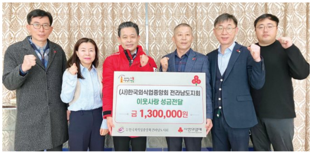
(사)한국외식업중앙회 전남도지회(회장 송기현)는 최근 전남 사랑의열매(회장 노동일)에 이웃사랑 성금 130만 원을 기탁했다.