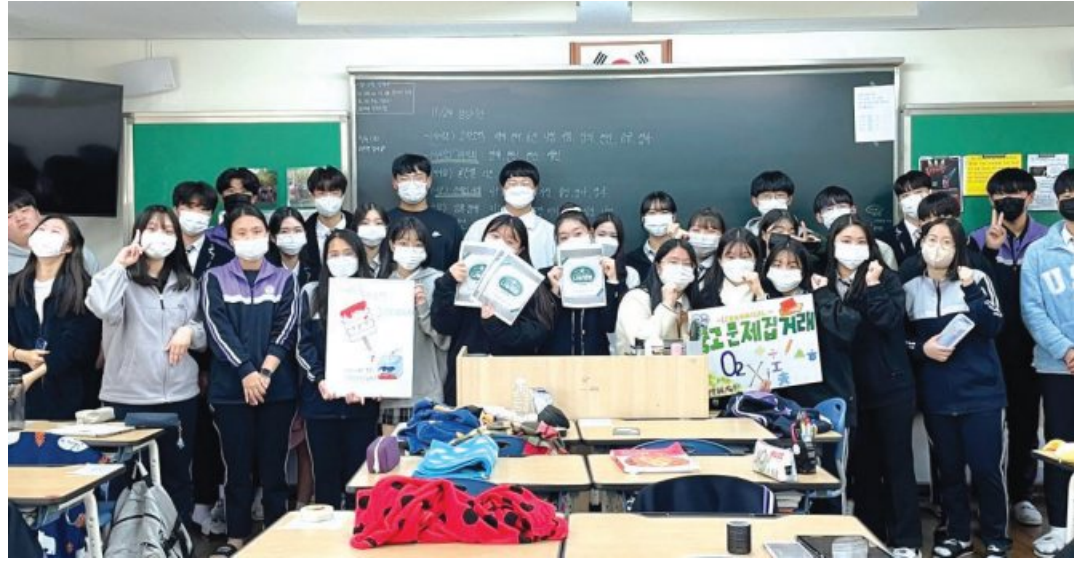
장덕고 역사동아리 학생들이 바자회를 열고 수익금 전액을 일제강제동원시민모임에 기부했다.

동아리 학생들은 지난 활동의 역사가 담긴 동아리 카페 게시글을 참고하며 행사를 준비했다. 시간이 많