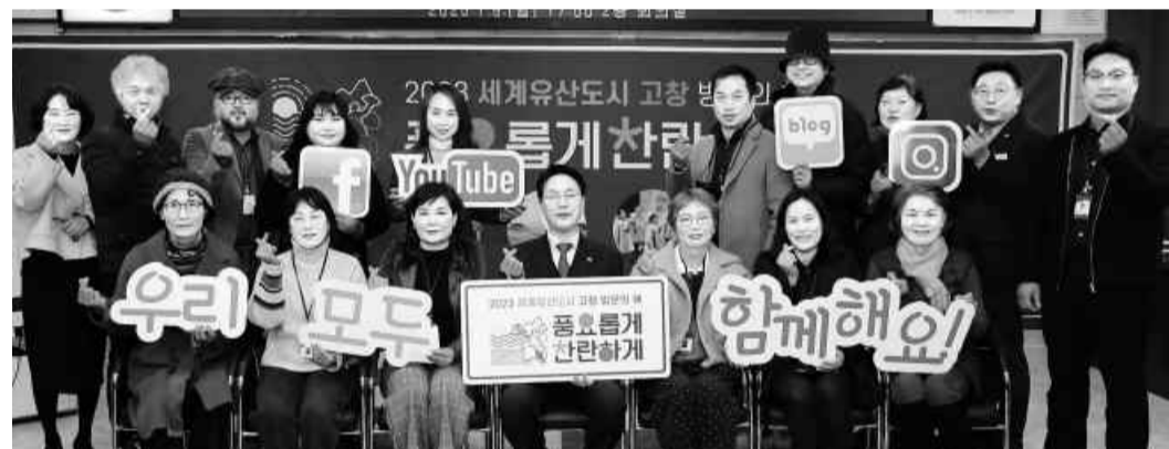
고창군이 '2023 세계유산도시 고창 방문의 해'를 맞아 지역의 다양한 정보와 생생한 소식을 전달할 홍보 서포터즈 발대식을 가졌다.