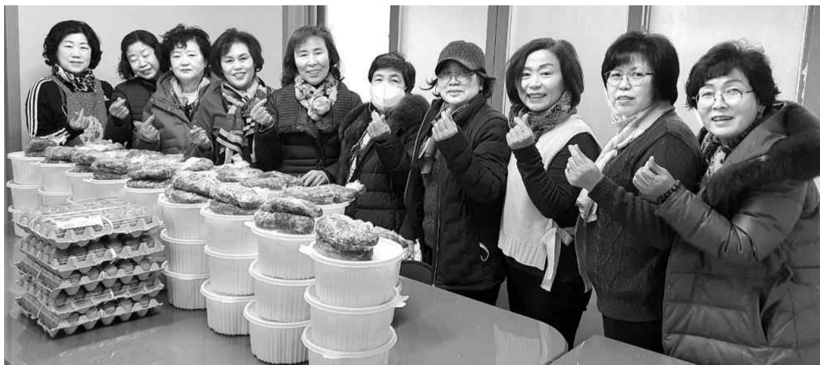
정읍시 여성단체협의회 회원들이 밑반찬 나누기 봉사에 앞서 포즈를 취하고 있다.