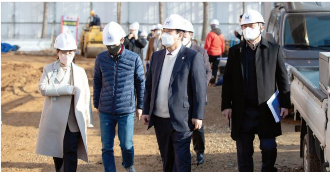
이정선(왼쪽에서 세번째) 광주시교육감이 최근 경양초등학교 공사현장을 방문했다. 이 교육감은 공사 현장을 살피고 공사 관계자들에게 안전을 최우선으로 시공에 힘써줄 것을 당부했다. 경양초교는 오는 3월1일 개교한다.