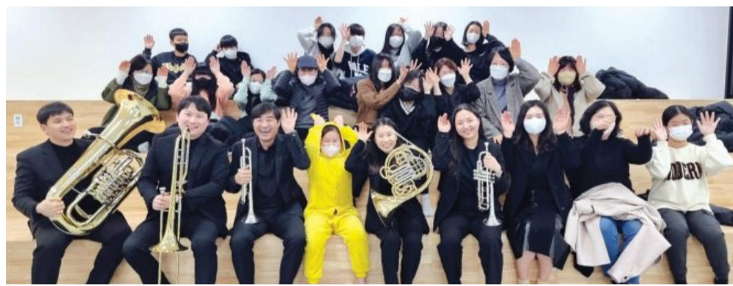
광주대 신년 음악회를 마친 참여자들이 기념촬영을 하고 있다.