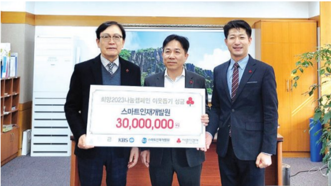
스마트 인재개발원은 최근 광주사랑의열매에 희망2023나눔캠페인 성금 3000만 원을 기부했다.