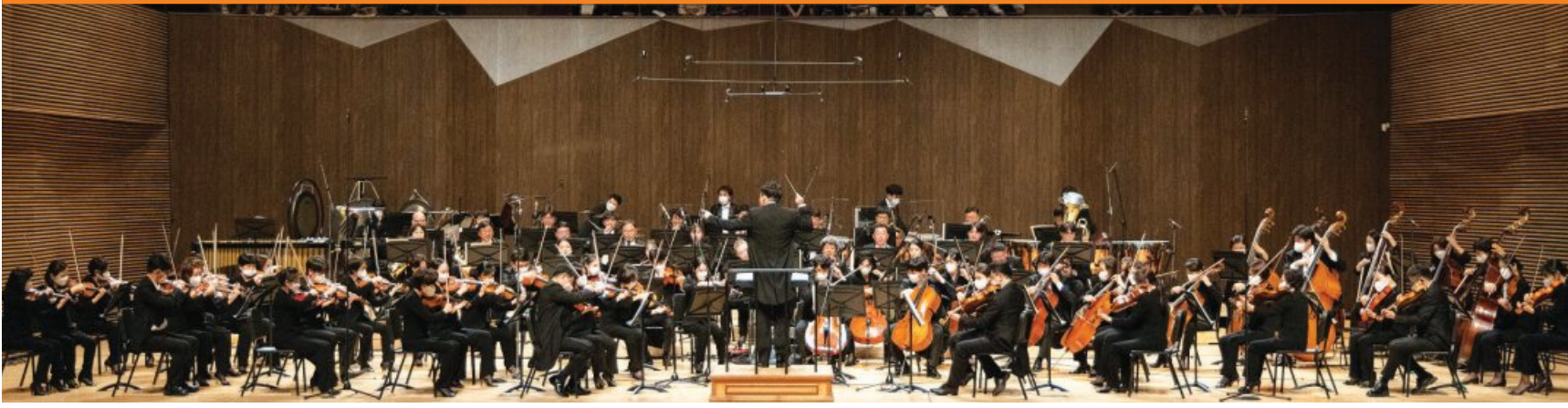
광주시립교향악단 공연 장면.