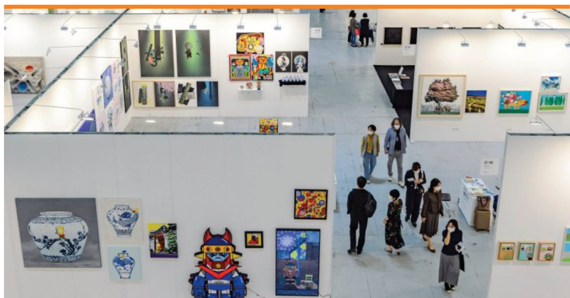
광주미협이 회원 500여명이 참여하는 대규모 프로젝트를 진행한다. 사진은 광주미협 주관 '아트광주' 행사 모습.