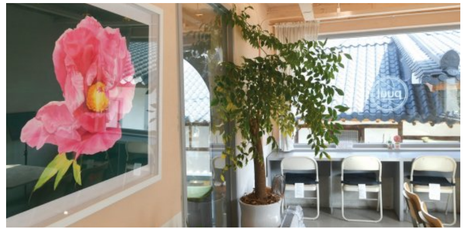
2021년 양림동골목비엔날레 행사 모습.

지난 2020년 처음 시작된 양림동골목비엔날레는 즐거운 축제였다. 사람들의 발길이 잦은 카페와 맛있는 먹을거리가 가득한 식당들에는 그림이 걸리고 조각 작품이 놓였다. 작가들의 작업 스튜디오를 방문하는 즐거움도 누렸다.