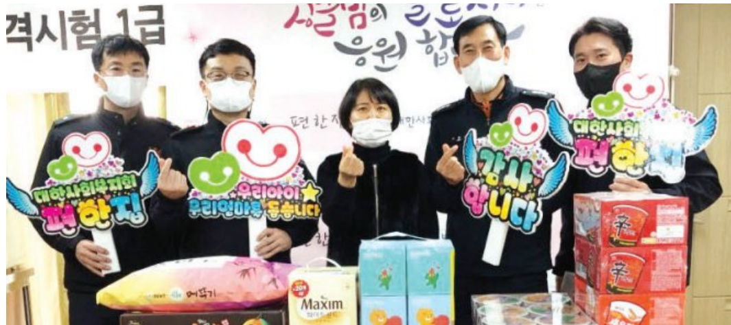
광주시 광산소방서는 최근 설 명절을 맞아 운수동 미혼모자 공동생활시설(대한사회복지회 편한집)을 방문해 식료품, 생필품 등의 위문 물품을 전달했다.