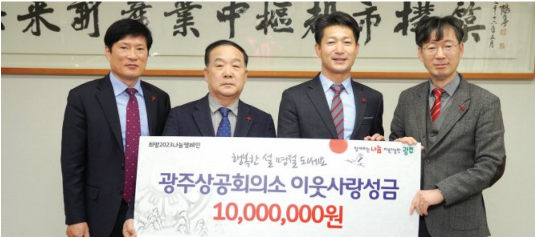
광주상공회의소(회장 정창선)는 설명절을 맞이해 '희망 2023 나눔캠페인' 성금 1000만 원을 기부했다.