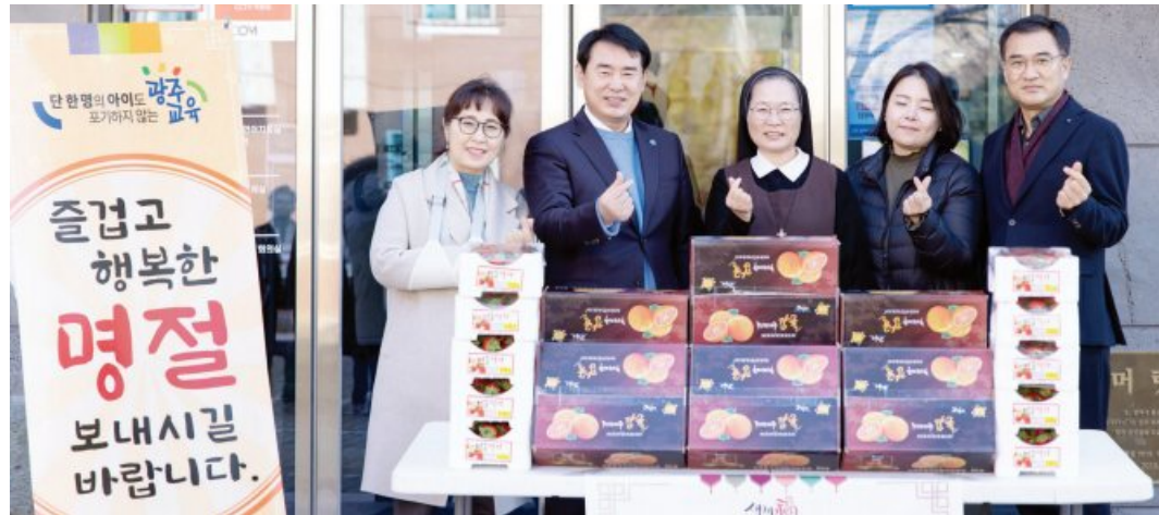
광주시교육청(교육감 이정선)이 설을 앞두고 지난 17일 소화자매원(남구 발달장애인거주시설) 등 사회 복지시설 4곳을 방문해 생활용품을 전달했다.