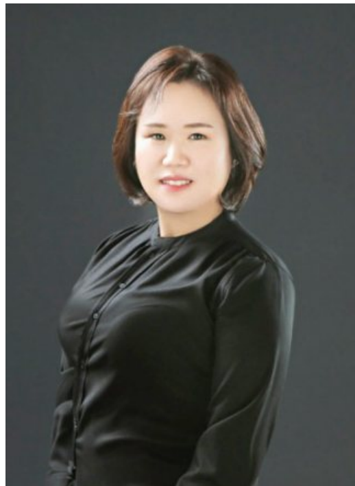
원을 방문해 아이들과 놀아주고 빨래도 했다. 또 요양원을 찾아가서는 어르신 팔다리를 주물러 드리는 봉사도 해왔다. 현재는 장수사진 뿐 아니라 아동보

배 대표의 봉사활동은 어느 한순간 시작된 게 아니었다. 사진관 직원으로 일하면서든 꾸준히 고아