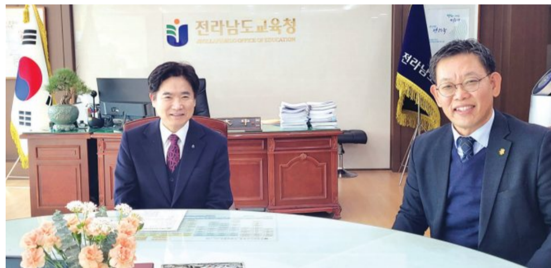
광주전남지방병무청(청장 김용우)은 2일 전라남도교육청을 방문해 김대중 교육감과 병무행정 현안을 공유하는 자리를 가졌다.