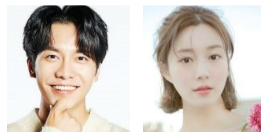
‘닥터 프리즈너’, ‘엘리스’ 등에 출연했으며 배우 견미리의 딸이자 이유비의 동생이다.

가수 이승기(왼쪽)가 배우 이다인과 올해 4월 화촉을 밝힌다. 이승기는 7일 자신의 사회관계망서비스(SNS)를 통해 “제가 사랑하는 이다인 씨와 이제 연인이 아닌 부부로서 남은 생을 함께 하기로 했다”고 밝혔다. 그는 “오는 4월 7일 결혼식을 올린다”며 “평생 책임질 사람이 생겼기에, 기쁜 마음으로 이 소식을 여러분께 직접 전하고 싶었다”고 썼다. 이승기와 이다인은 2021년 5월 열애 사실을 인정 후 공개 연애를 지속해왔다. 이다인은 드라마 ‘이리와 안아줘’,