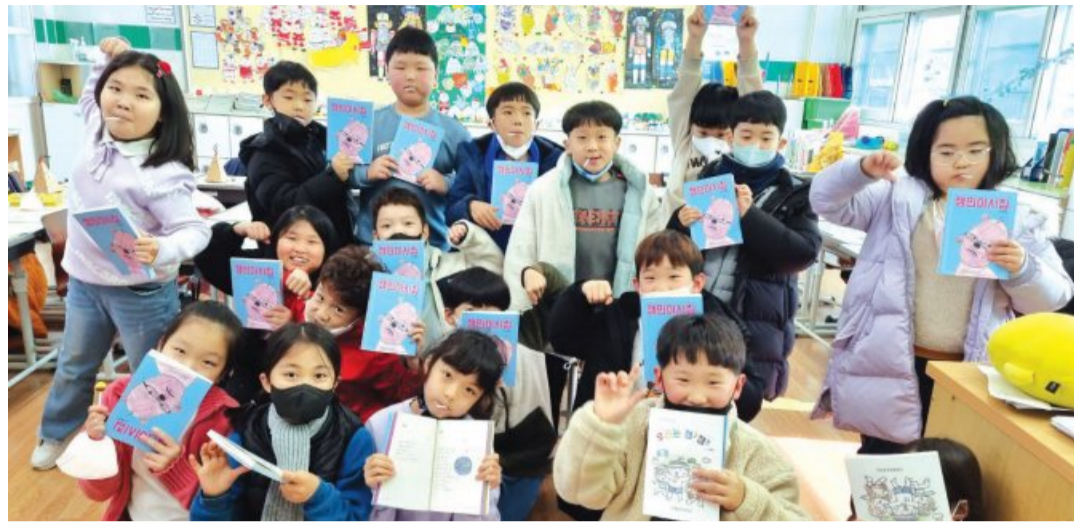
‘잼민이’를 모티브로 두 권의 시집을 펴낸 구례중앙초 어린이들.

했다”고 설명했다. 시집 제목은 중학생이 된 학교 선배의 조언도 한 몫했다. ‘보석을 나타내는 ‘잼(gem)’을 따서 잼잼 시집이라고 하면 어떨까요’는 제안도 있었다. 그렇게 해서 1-3학년의 ‘우리는 잼잼’과 4-6학년의 ‘잼민이 시집’이 세상에 나오게 된 것. 수업은 시가 어렵게 느껴지는 아이들에게 흥미를 일깨우는 중심으로 이루어졌다. 먼저 퀴즈로 시 제목 맞추기, 다른 어린이들이 쓴 시 읽어주기로 시작했다. 수업이 끝나자 ‘나도 시 써보고 싶어요’라고 요청하는 아이들이 많았다는 후문이다. “한 아이가 자신 있게 시를 써내려가면 옆에서 보고 있던 아이들은 ‘친구가 하는데, 나도 할 수 있구나’하는 동력을 얻어요. 사실 시에 앞서 글은 물론 글씨조차 잘 쓰지 못하는 친구들이 많아요. 그나마 ‘우선 써 내려가라’고 말해줍니다. 자신감이 한 획을 그어 만들고 또 다른 문장을 쓰게 하는 힘이 되는 거죠.”