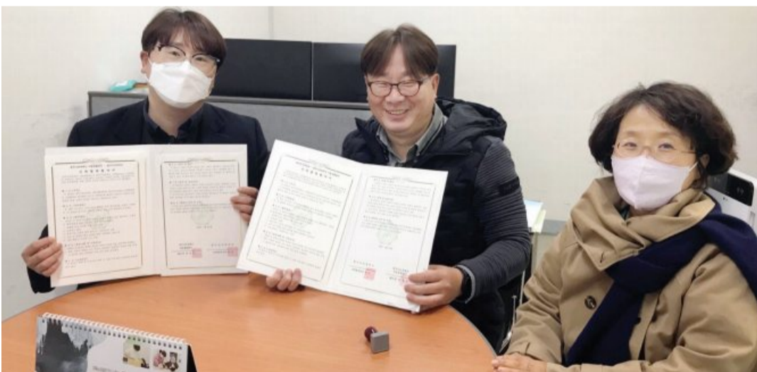
광주여자대학교 작업치료학과는 최근 광주나눔장애인자립생활센터에서 맞춤형 인력양성 및 연구·지원사업 상호협력에 관한 업무협약을 체결했다.