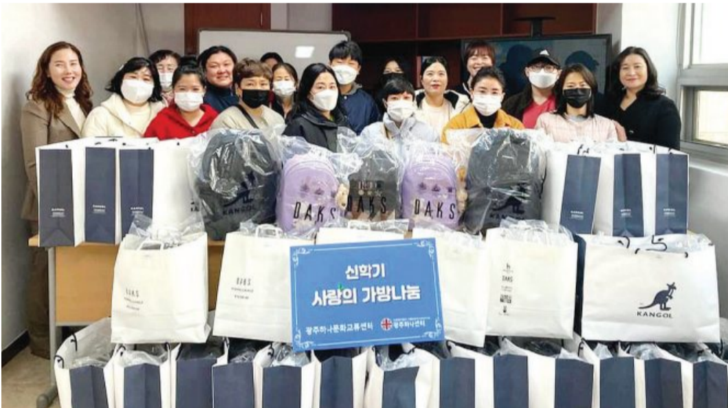
광주하나문화교류센터와 광주하나센터는 (주)현대솔라텍 후원으로 최근 제7회 신학기 사랑의 가방 나눔 행사를 개최했다.