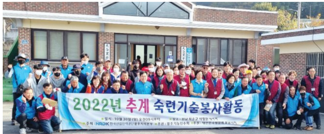
지난해 10월 화순군 대곡리를 찾아 숙련 기술 봉사활동을 펼친 '광주기능회' 회원들이 주민들과 함께 기념촬영을 하고 있다.

서 교수는 회원들과 그동안 수십 곳을 돌며 봉사활동을 펼쳐왔지만 특별한 기억에 남는 곳이 있다고 했다.