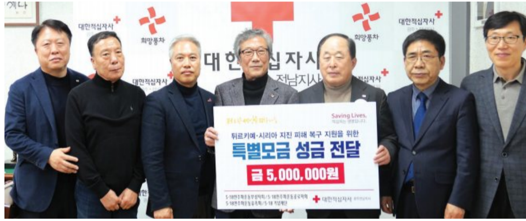
5·18기념재단과 공법단체 5·18 3단체(5·18민주화운동부상자회,공무자회,유족회)는 최근 대한적십자사 광주전남지사(회장 허정)에 튀르키예-시리아 지진 성금 500만원을 기부했다.