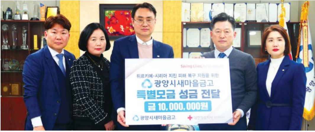
광양시새마을금고(이사장 김재욱)는 대한적십자사 광주전남지사(회장 허정)에 튀르키예-시리아 지진 피해 복구 성금 1000만원을 전달했다.