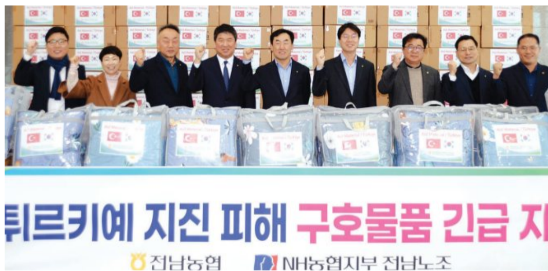
튀르키예 지진 피해 구호물품 긴급 지원 전남농협 NH농협지부 전남노조

라, 튀르키예 이재민들이 하루빨리 일상을 되찾으시길 기원한다"고 말했다. 박종탁 본부장은 "예상치 못한 재난으로 고통받고 있는 튀르키예 국민들께 깊은 애도를 표한다"며, "이번 구호물품 전달이 지진 피해로 어려움을 겪고 있는 이재민들에게 조금이라도 도움이 되길 바란다"고 말했다. 한편 농협은 구호금 40만 달러 지원, 구호물품 기부 참여 등 튀르키예 지진 피해 복구를 위한 전사적 지원에 나서고 있다. /김민석 기자 mskim@kwangju.co.kr