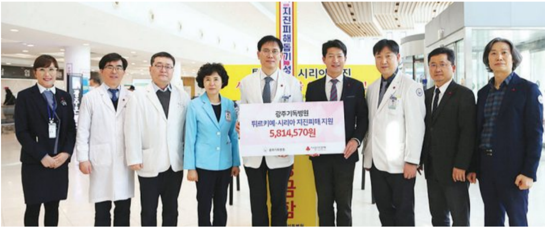
광주기독병원(병원장 최용수)은 튀르키예-시리아 지진피해 지역의 피해복구와 이재민을 돕기 위한 성금을 581만4570원을 지난 21일 사회복지공동모금회 광주지부를 통해 전달했다.