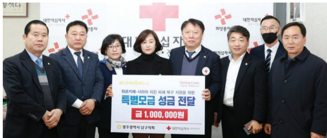
광주시 남구의회(의장 황경아)는 최근 튀르키예-시리아 지역에서 강진으로 피해를 입은 이재민 긴급구호를 위한 성금 100만원을 대한적십자사 광주전남지사(회장 허정)에 기부했다.