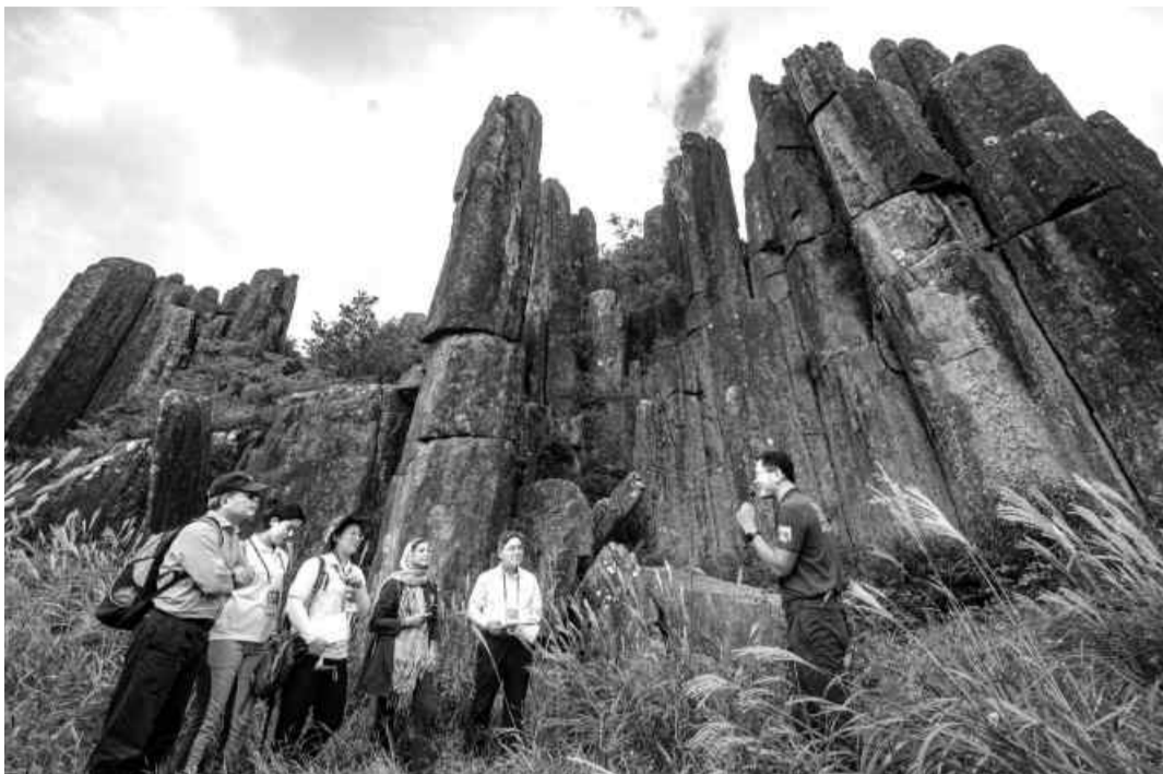
광주와 전남, 담양, 화순을 잇는 무등산권의 주상절리대와 하천, 습지 등이 유네스코 세계지질공원위원회로부터 재인증받아 2026년까지 지질공원으로의 지위를 유지하게 됐다. 사진은 지난 해 9월 무등산 세계지질공원 재인증 실사를 위해 무등산 주상절리대인 입석대를 찾은 유네스코 실사단 모습.

광주시·전남·담양·화순 협력 담양 구상암 등 명소 4곳 추가발굴 3월4일 무등산 정상개방 기념행사 권고사항 후속조치 발전 계획 마련