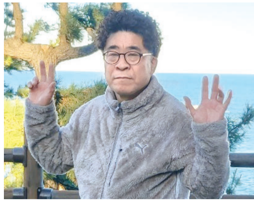
“국민학교 5학년 때 집을 나와 돈을 벌었습니다. 우연히 배운 제빵으로 1987년부터 목포 동부시장에서 30여년 가량 빵집을 운영했습니다. 운이 좋아서 빵집이 잘 됐어요. 경제적으로 여유가 생겨 빵집 운영을 멈추고 초등학교 3학년 과정에 등록했습니다.”

지 못한 성인들을 대상으로 운영되는 평생교육원 초등문해과정을 다니며 ‘내 인생의 봄’이라는 제목의 시를 썼다. 그의 시에선 어린시절 불우했던 가정사로 인해 제때 학교를 나오지 못해 평생 간직하고 있던 배움의 ‘한’과 환갑에 가까워져서야 글을 깨우친 이투 말할 수 없는 기쁨이 오롯이 묻어난다. 그는 몇년 전만 하더라도 한글을 완벽히 읽고 쓸 수 없었지만 지난 2020년 목포제일정보중고등학교 부설 평생교육원에 등록해 뒤늦은 학업을 시작하면서 시를 쓸 수 있을 정도로 실력을 갖추게 됐다.