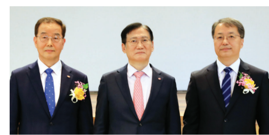
전정비시장 신뢰성과 기반 강화를 통해 발전정비 에너지 공기업으로서 소명을 다하고 한전KPS 원전 정비 사업의 새로운 미래를 창출할 것”이라고 밝혔다.