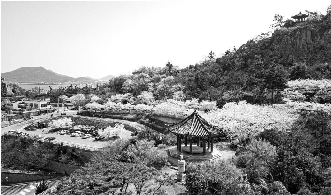
목포시가 4월 유달산 봄축제를 시작으로 풍성하고 다채로운 행사를 통해 관광객 맞이에 나선다. 유달산에 활짝핀 벚꽃.

시는 청년은 물론, 외국인이 참여할 수 있는 프로그램을 강화하는 등 지역민의 축제가 아닌 전 국민이 찾고 즐길 수 있는 문화관광축제로 도약하기 위해 다채로운 콘텐츠 개발에 힘을 기울인다.