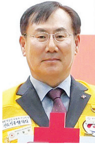
조 회장과 회원들은 직접 집에서 밥을 지어 유족들이 머물고 있는 체육관으로 나르며 유족들과 함께 고통을 나눴다.

를 느끼고 적십자 봉사회에 가입하게 된 것. 진도에서 태어난 그는 고향에서 초·중·고교를 다녔다. 광주에서 대학을 졸업했지만 진도로 돌아와 사회생활을 했다. 이후 직장을 그만두고 자영업업을 하면서 봉사할 시간이 늘어나 봉사회 활동에 적극적으로 나서게 됐다. 적십자 봉사회 가입일수는 8194일, 총 봉사 시간은 7875시간. 20년 남게 활동을 하다 보니 기억에 남는 봉사활동이 많다. 그 중에서도 잊혀지지 않는 사건은 2014년 발생한 세월호 참사다.