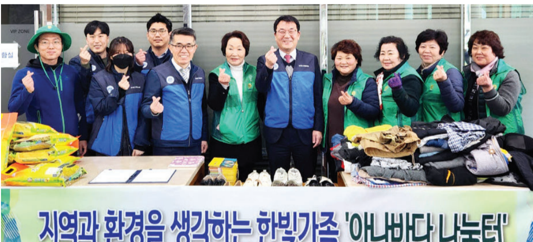
한빛원전지력본부는 최근 한빛원전지력본부 사택에서 영광군새마을부녀회와 함께 ‘아나바다 운동’ 나눔 장터 행사를 진행했다.